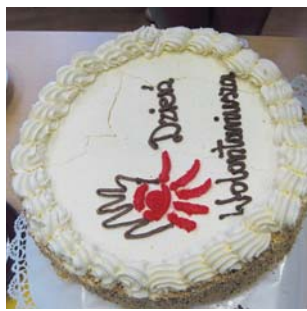
Wolontariusze obchodzą 5 grudnia swoje święto – Międzynarodowy Dzień Wolontariatu

Zaangażowanie polskiego społeczeństwa w działania na rzecz innych ludzi lub całej wspólnoty choć słabe, od trzech lat rośnie. W 2008 r. 11,3 proc. dorosłych Polaków poświęcało swój czas na bezpłatną pracę na rzecz innych, w 2009 r. było ich 12,9 proc., a w 2010 r. – 16 proc. Szacuje się, że co roku około 100 milionów Europejczyków angażuje się w jakąś formę wolontariatu. W Polsce około cztery miliony ludzi zajmuje się pracą w wolontariacie.