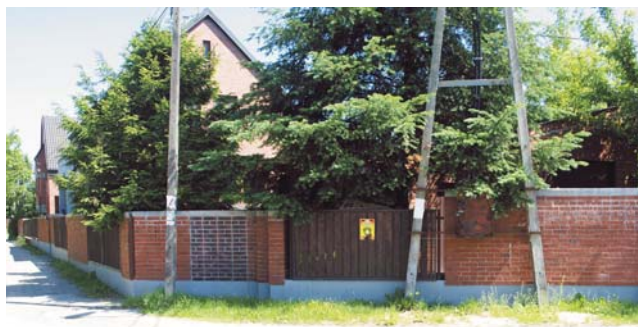
To ogrodzenie trzeba będzie rozebrać, ponieważ w tym miejscu zaplanowano dwupasmową drogę

Czy ktoś wpadłby na pomysł poprowadzenia drogi środkiem osiedla Konstancja, gdy tuż obok są niezabudowane tereny? Nie, bo mieszkańcy osiedla nie zgodziliby się na takie rozwiązanie. Mieszkańcy ul. Kołobrzeskiej też się nie godzą.