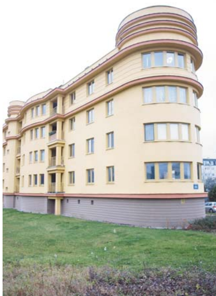
Plan centrum dopuszcza budowę całych kwartałów takich i jeszcze wyższych bloków

Burmistrz i przewodniczący rady obawiają się, że nieuchwalenie planu centrum i strefy A przed wejściem w życie nowej ustawy uzdrowskiej spowoduje konieczność wprowadzenia zmian w planach (dostosowania ich do zapisów znowelizowanej ustawy uzdrowskiej) i nowych uzgodnień, co opóźni uchwalenie planów nawet o rok i umożliwi przez ten rok inwestorom uzyskiwanie, zgodnie z nową ustawą, decyzji o warunkach zabudowy. Czy nowi radni są świadomi, że procedura uzyskania warunków zabudowy trwa ok. sześciu miesięcy, a w przypadku, gdy gmina przystąpiła do sporządzenia miejscowego planu, urząd może zawiesić postępowanie nawet na 12 miesięcy? Czy warto się tak śpieszyć? Pamiętajmy także, że w strefie A ochrony uzdrowskiej, zgodnie z nową ustawą, nadal nie ma możliwości uzyskania warunków zabudowy.