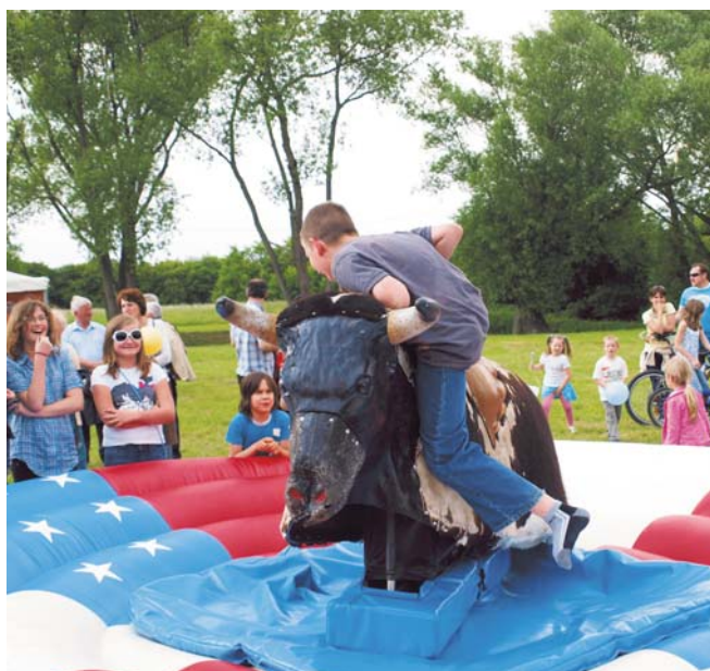
W Dzień Dziecka na najmłodszych mieszkańców Konstancina-Jeziorn czekało mnóstwo atrakcji

oczku wodnym nie narzekało na brak emocji: ryby brały. Złowione okazy wypuszczane były z powrotem do wody. Wszyscy uczestnicy zawodów otrzymali specjalne dyplomy. (R)