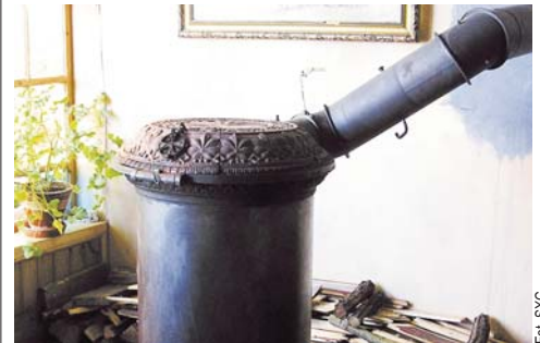
Źródłem zacczadzenia bywa często stary niesprawny piec

Każdego roku z powodu zatrucia tlenkiem węgla (CO), potocznie zwanego czadem, umiera w województwie mazowieckim kilkadziesiąt osób.