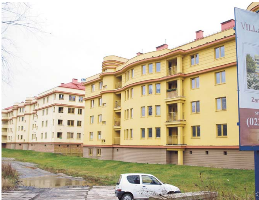
W Konstancinie cały czas powstają nowe osiedla domów wielorodzinnych