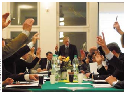
Rady wielu miast wprowadziły imienne głosowania

Dla nas, mieszkańców, najważniejsza jest dobra współpraca burmistrza z radą i większa jawność podejmowanych decyzji. Wiele rad miejskich innych miast wprowadziło zasadę imiennego głosowania wniosków komisji merytorycznych i całej rady. To świetny pomysł, każdy z mieszkańców wiedziałby komu zawdzięcza konkretną decyzję: komu asfaltowanie, komu zaniechanie remontu szkoły w Opaczu, komu stylowe oświetlenie zamiast nowego przedszkola. Znowu się rozmarzyłem, ale podobno wszystko zaczyna się od marzeń, a chcieć to móc.