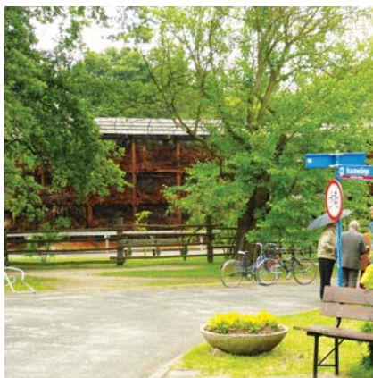
Nawet jedyna na Mazowszu (i jedna z nielicznych w Polsce) tętnia nie jest magnesem przyciągającym do konstancińskiego Parku Zdrojowego

Projekt zakłada również odtworzenie (w ramach renaturyzacji rzeki Małej) roślinności brzegowej i urozmaicenie istniejącej roślinności o drzewa i krzewy charakterystyczne dla tego typu terenów. Do tego trzy place zabaw, siedem tematycznych placów wypoczynkowych, a na terenie rozlewiska rzeki Jeziorki – ścieżka edukacyjna. „A, to już rozumiem, widocznie będziemy odbywać cyklicznie ćwiczenia praktyczne z układania worków z piaskiem. Brawo dla burmistrza za kreatywne podejście do lokalnych problemów i potrzeb” – tak komentował projekt jeden z użytkowników internetowego forum Konstancin.com.