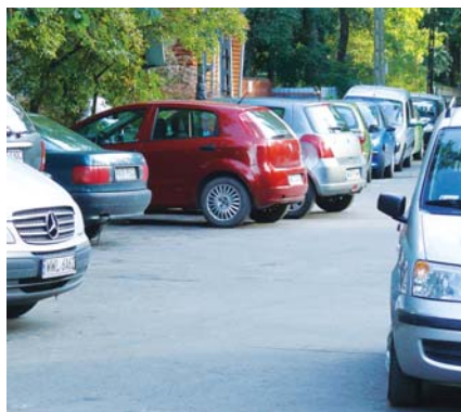
W pobliżu pomnika Jana Pawła II jest miejsce tylko dla sześciu samochodów, a w najbliższej okolicy i tak parkują dziesiątki aut

Uporządkować też trzeba parkową zieleni. Rzeźwiście, jest w parku kilka starych, spróchniałych drzew, które – choćby ze względu na bezpieczeństwo spacerowiczów – trzeba wyciąć. Na miejscu wyciętych posadzone zostaną nowe drzewa i krzewy. W parku powstaną nowe trawniki i rabaty kwiatowe.