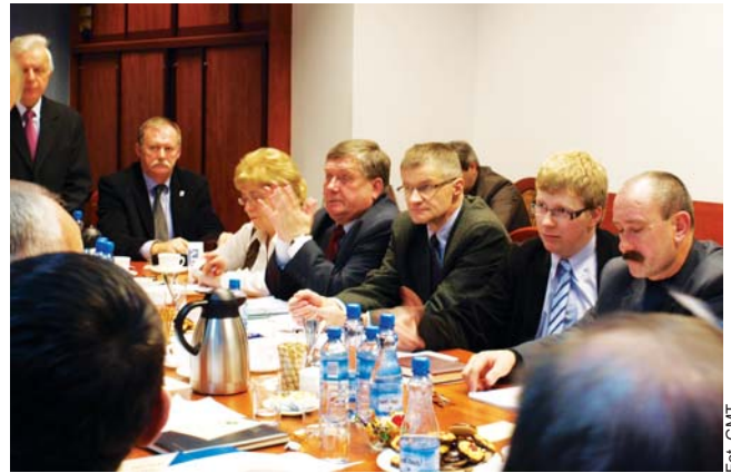
Rada miejska jest ciałem uchwałodawczym – to taki gminny parlament, który nie sprawuje bezpośrednich rządów

Trudno mówić o dobrej współpracy między organami wykonawczym i uchwałodawczym, jeśli o działaniach burmistrza radni dowiadują się z gazet lub przypadkowo-