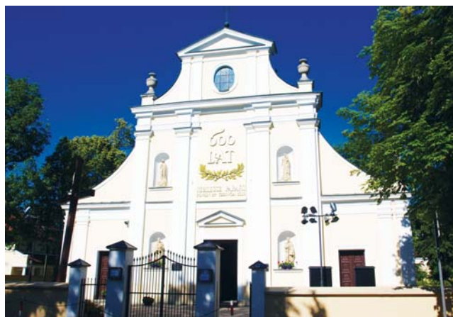
Historia parafii św. Elżbiety w Powsinie sięga początków XV w. Kościół jest jeszcze starszy, choć obecny budynek ostatecznie uzyskał swój kształt w XX w.

Pierwotny kościół w Powsinie był drewniany. Zniszczono go najprawdopodobniej w czasie potopu szwedzkiego. Kolejny, zbudowany również z drewna, najprawdopodobniej w ogóle nie został ukończony. Fundatorką obecnego murowanego kościoła, zbudowanego w 1725 r. była Elżbieta z Lubomirskich Sieniawska. Jego projektantem był Józef Fontana, słynny architekt epoki baroku. W 1889 r. do jednonawowej świątyni dobudowano nawy boczne, kruchte