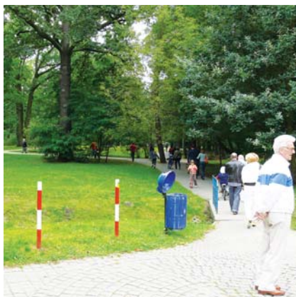
Poza odbywającymi się tu imprezami, Park Zdrojowy nie ma odwiedzającym zbyt wiele do zaproponowania

Projekt zakłada również odtworzenie (w ramach renaturyzacji rzeki Małej) roślinności brzegowej i urozmaicenie istniejącej roślinności o drzewa i krzewy charakterystyczne dla tego typu terenów. Do tego trzy place zabaw, siedem tematycznych placów wypoczynkowych, a na terenie rozlewiska rzeki Jeziorki – ścieżka edukacyjna. „A, to już rozumiem, widocznie będziemy odbywać cyklicznie ćwiczenia praktyczne z układania worków z piaskiem. Brawo dla burmistrza za kreatywne podejście do lokalnych problemów i potrzeb” – tak komentował projekt jeden z użytkowników internetowego forum Konstancin.com.