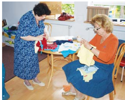
Zbieraniem darów dla powodzian zajęli się wolontariusze

Setki tysięcy osób w powodzi straciły wszystko. Nie zostawiamy ich samym sobie. Oczywiście, pomaga im rząd i różne organizacje, ale nie do przecenienia jest pomoc życzliwych ludzi. To właśnie my możemy szybciej dotrzeć do potrzebujących – nam nie potrzebne są zaświadczenia, pieczętki, podania, jednym słowem: cała biurokracja.