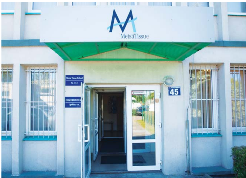
Zarząd miasta przez wiele lat nie zrobił nic, by rozwiązać problem oczyszczalni i zaopatrzenia Mirkowa w media. Teraz pomoc w tej sprawie deklaruje spółka, która wcale nie musi tego robić

Zgodnie z ustawą o samorządzie gminnym, zaspokajanie zbiorowych potrzeb wspólnoty należy do zadań własnych gminy. Art. 7 pkt 1 ust. 3 ustawy stanowi: „W szczególności zadania własne obejmują sprawy: wodociągów, zaopatrzenia w wodę, kanalizacji, usuwania i oczyszczania ścieków komunalnych, utrzymania czystości oraz urządzeń sanitarnych, wysypisk i unieszkodliwiania odpadów komunalnych, zaopatrzenia w energię elektryczną i ciepłą oraz gaz”. Pomimo to Metsä Tissue zatrudniła konsultanta, który pomoże w rozwiązaniu istotnych dla mieszkańców problemów.