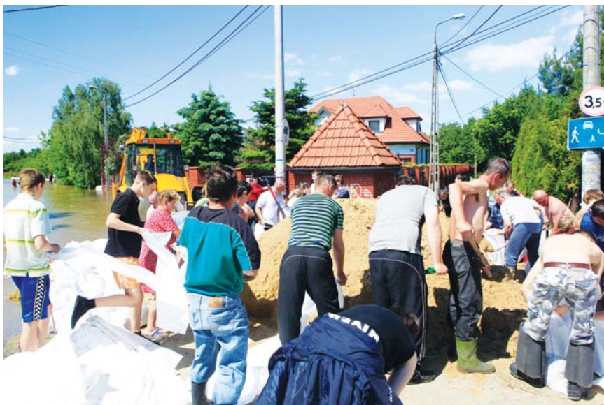
Większych strat udało się uniknąć dzięki wspólnemu wysiłkowi mieszkańców Skolimowa i strażaków

Trwa wielkie sprzątanie po zalaniu i szacowanie strat. Mieszkańcy Skolimowa liczą na pomoc urzędu miejskiego – dziś i w przyszłości.