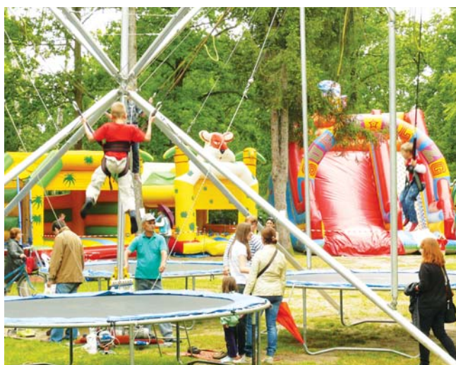
Dzieci szczególnie upodobały sobie euro-bungee

kultury, sztuki, edukacji i sportu, ale patrząc na osiągnięcia naszych gości, z pewnością warto ją rozszerzyć. (MM)