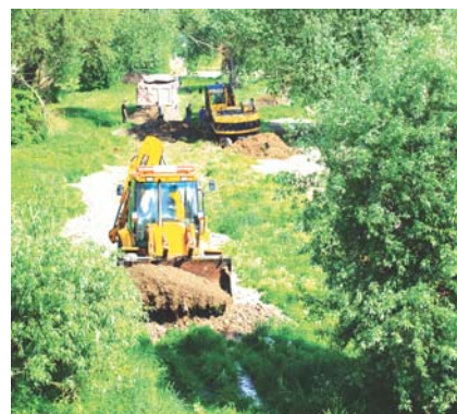
Także do umacniania brzegów Jeziorki trzeba było użyć ciężkiego sprzętu