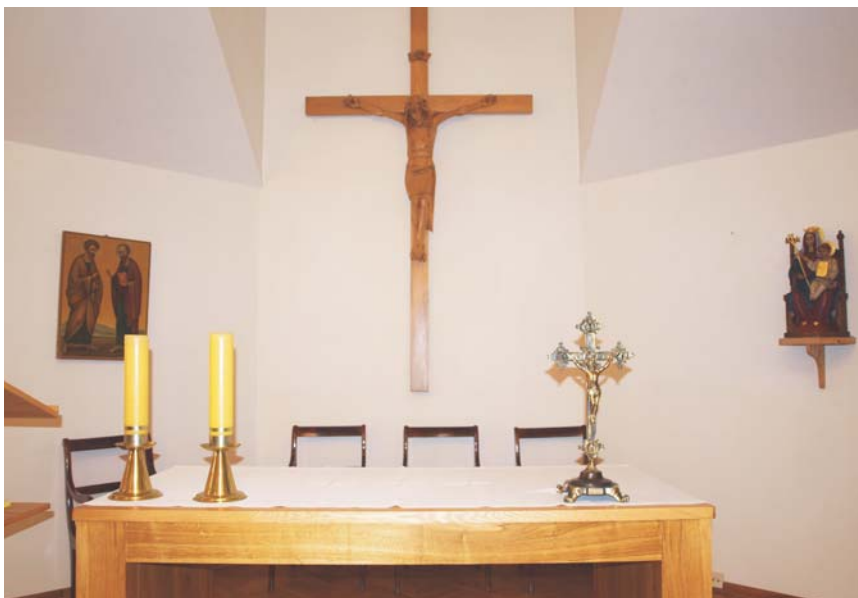
Wnętrze kaplicy polskokatolickiej parafii misyjnej św. św. Apostołów Piotra i Pawła

Kościół Polskokatolicki jest członkiem Unii Utrechckiej Kościołów Starokatolickich, Światowej Rady Kościołów i Polskiej Rady Ekumenicznej.