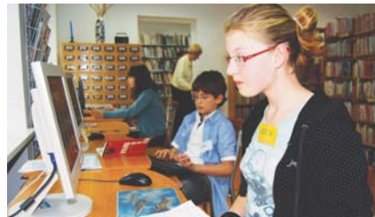
W warsztatach uczestniczy młodzież z konstantynińskich szkół

Z przeprowadzonego przeze mnie sondażu wynika, że niektórym osobom odpowiada to, co istnieje i zostało już w Konstantynie zrobione, a innym brakuje miejsc spotkań, placówek wychowawczych. Zawadzają im przeszkody komunikacyjne utrudniające kontakt ze światem. Były zarówno pozytywne, jak i negatywne odpowiedzi.