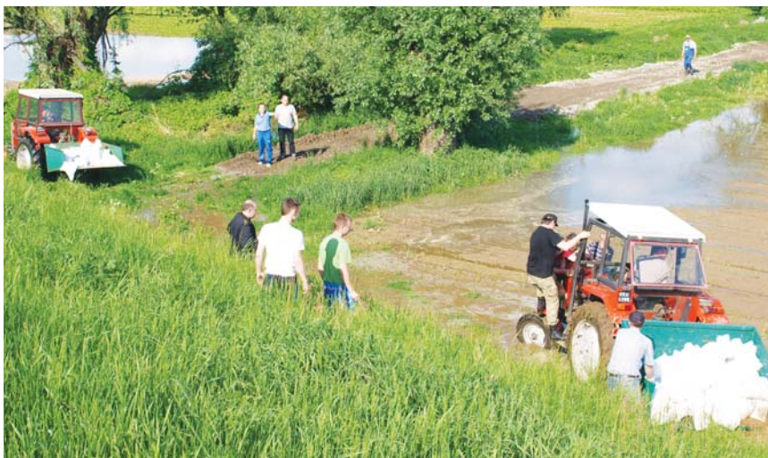
Umacnianie wałów wymagało wytężonej pracy strażaków i mieszkańców przez kilka dni