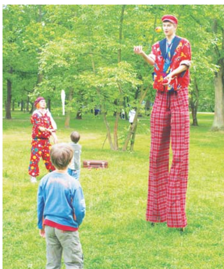
Szczudlarze zabawiali najmłodszych uczestników imprezy