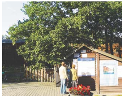
Aleja Miłośników Konstantyna miałyby się zaczynać przy tętni

Kojarzenie nazwy alei z nazwą TMPiZ jest o tyle zasadne, że członkowie towarzystwa to również Miłośnicy Konstantyna, którzy bezinteresownie z pasją poświęcają swój czas, umiejętności i własne pieniądze dla idei. Tą ideą jest piękno, ochrona wa-