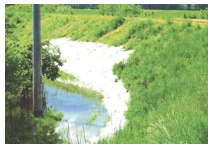
Pomimo, że woda zaczęła opadać, wał w Dębówce przesiąkał jeszcze 24 maja