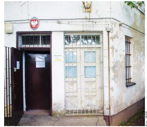
Za wynajem tego budynku urząd miasta płaci miesięcznie 10 tys. zł

W ślad za protokołem z kontroli budynków zajmowanych przez urząd miasta (pisał o niej w majowym numerze „Naszego Miasta – FMK”), Państwowa Inspekcja Pracy przesłała nakaz, w którym wymienione zostały wszystkie stwierdzone nieprawidłowości i terminy ich usunięcia. Większość z nich nie jest jednak możliwa do przeprowadzenia w lokalowych realiach naszego magistratu.