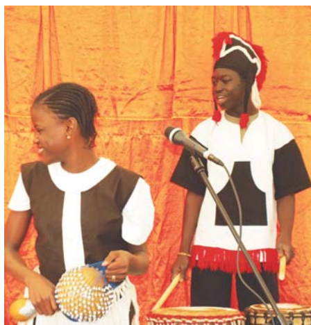
W Słomczynie wystąpił dziecięcy zespół muzyczny Mango Bisap z Burkiny Faso (Górnej Wolty)

Z okazji Dnia Dziecka w naszym mieście odbyło się kilka imprez: 29 maja – prawdziwie Międzynarodowy Dzień Dziecka w Czarnowie, z mnóstwem atrakcji dla młodszych i starszych dzieci, zorganizowany przez sołectwo Czarnów i Urząd Miasta i Gminy Konstancin-Jeziorna; 30 maja – Misyjny Dzień Dziecka w Amfiteatrze w Parku Zdrojowym, zorganizowany przez Zgromadzenie Sióstr od Aniołów oraz Bajkowy Dzień Dziecka w Słomczynie, zorganizowany przy współudziale sołectw Dębówka, Kawęczynek, Borowina i Piaski. (R)