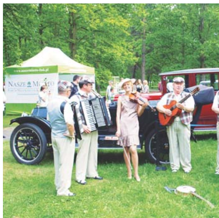
Orkiestra z Targówka na tle namiotu-stoiska naszej gazety

W sobotę 30 maja w Parku Zdrojowym odbyła się tradycyjna Majówka nad Rzeką Jeziorką, której styl miał nawiązywać do lat 20. i 30. XX w. (R)