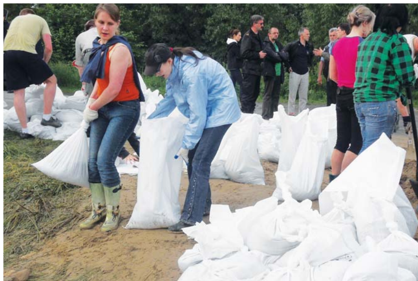
Do umacniania wałów ruszyli mieszkańcy nadwiślańskich sołectw naszej gminy

Wszystkie służby – policja, zawodowa i ochotnicze straże pożarne, straż miejska – zostały postawione w stan gotowości. To, że prędzej czy później wielka woda dotrze do Konstancina, wiadomo było od kilku dni. Dzień przed ogłoszeniem alarmu przeciwpowodziowego, w środę 19 maja, przedstawiciele powiatowego sztabu kryzysowego chcieli porozmawiać z