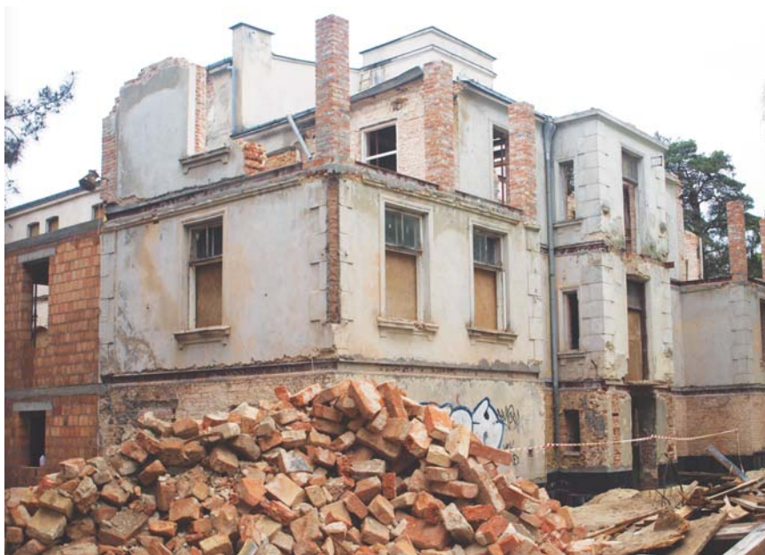
Hugonówka to kolejny konstanciński zabytek, który uległ dewastacji w wyniku niefrasobliwości opiekuna

– Oznacza, że nakazujemy odbudowę willi w stanie najbardziej przypominającym oryginał. Przygotowanie nakazu o przywróceniu do stanu jak najlepszego wymaga jednak od urzędu zdecydowanie więcej pracy niż w przypadku nakazu odbudowy, gdyż w załączniku musi znajdować się dokładny opis obiektu. Precyzyjny opis budynku jest konieczny, ponieważ nakaz nie zawierający pełnej charakterystyki budynku byłby z pewnością uchylony przez ministerstwo lub sąd administracyjny.