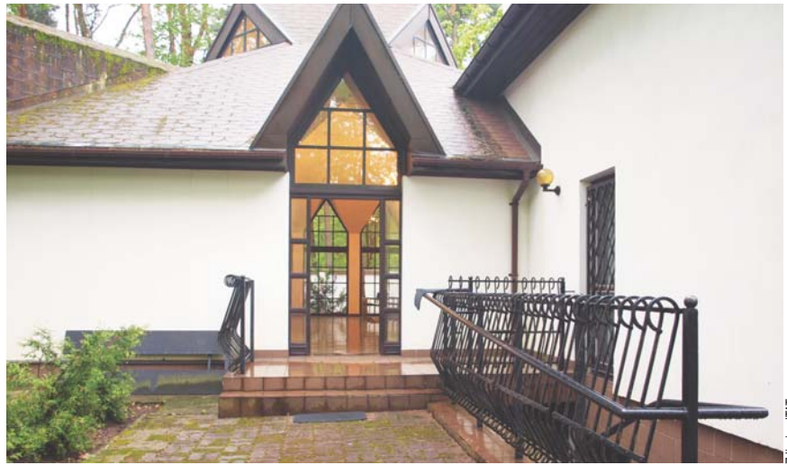
Międzynarodowe Centrum Konferencyjno-Studyjne im. bp. Edwarda Herzoga to ważny ośrodek Kościoła Polskokatolickiego w Polsce