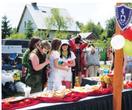
Zespół Szkół nr 4 ze Słomczyna przygotował włoskie stoisko na obchody Dnia Dziecka w Czarnowie