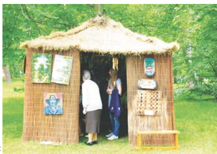
Wielką atrakcją Misyjnego Dnia Dziecka w Parku Zdrojowym była afrykańska chata